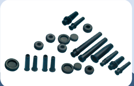
A20/A21/A22 - Pièces moulées en caoutchouc polychloroprène HELAVIA, en TPE caoutchouc thermoplastique Plioprène et en plastique.

En vérifiant préalablement avec l'installateur l'emplacement du produit et son environnement, nos pièces moulées et passe-fils, dont la masse est généralement inférieure à 10g, devraient être acceptés sans homologation particulière en application à 4.3 du paragraphe "Règles de regroupement" de la norme.