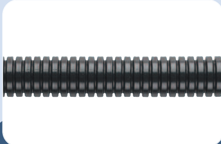
A7 - Gaine de protection renforcée, raccords et accessoires (0630)