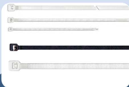
C12 - Attache-câbles SES-QUICK et accessoires de fixation (0186)