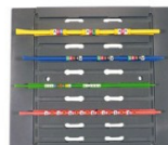
Tablette de pré-composition